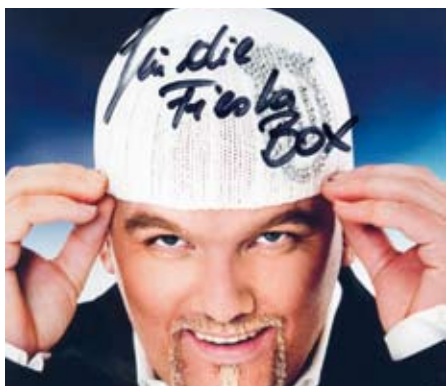
Exklusiv für fiesta aufs weiße Kapperl geschrieben.