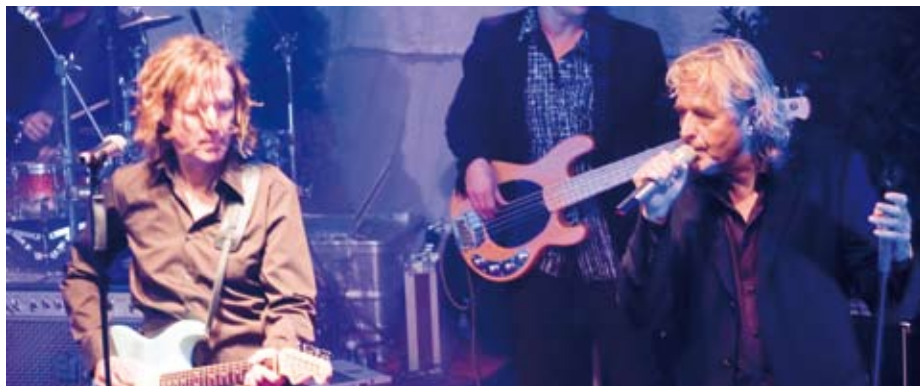
Auftritt der Brüder Jogl und Charly von Brunner & Brunner mit Band als Sensation im Oktoberfestzelt auf der Herbstmesse.