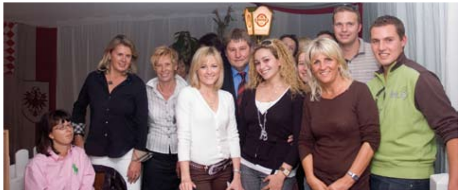
Helene Fischer mit einigen Fans in der fiesta-Box: der Andrang rund um die deutsche Sängerin war groß, dennoch konnten alle Autogrammwünsche erfüllt werden.