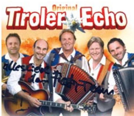
Gruß an die fiesta-Leser vom Tiroler Echo mit ihrer neuen CD.