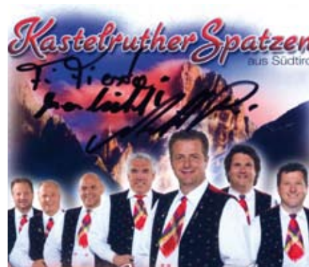
Die neue Kastelruther Spatzen CD mit Widmung als Geschenk für fiesta.