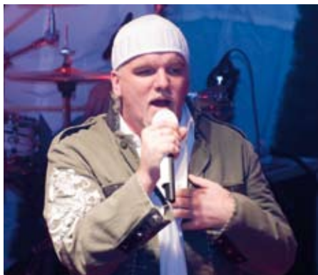
Immer wieder gern in Tirol: DJ Ötzi riss beim Auftritt das Publikum mit.