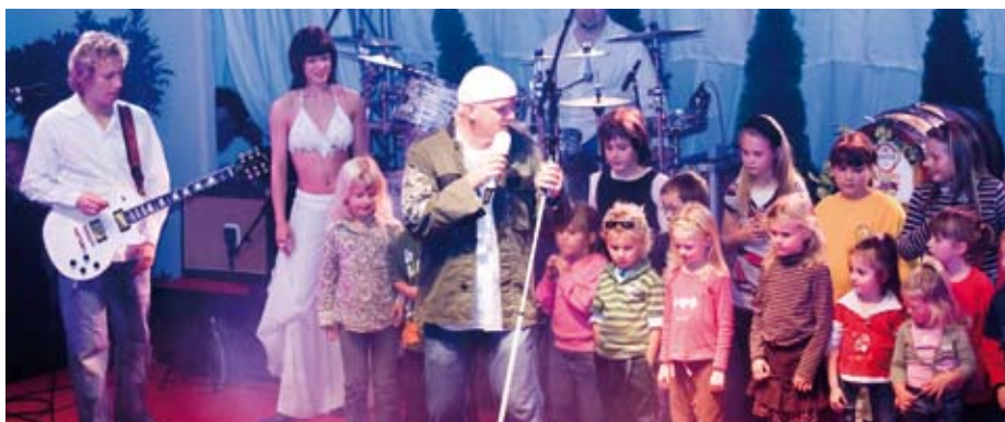
Kinder aus dem Publikum durften zu DJ Ötzi auf die Bühne und sangen zusammen: „Ein Stern, der deinen Namen trägt...“.