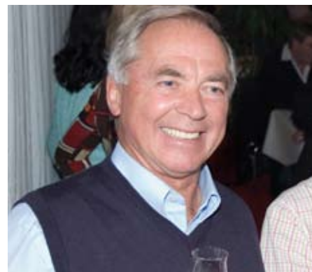
Schilgende Karl Schranz schaute in der fiesta-Box vorbei: Grüße vom Arlberg.