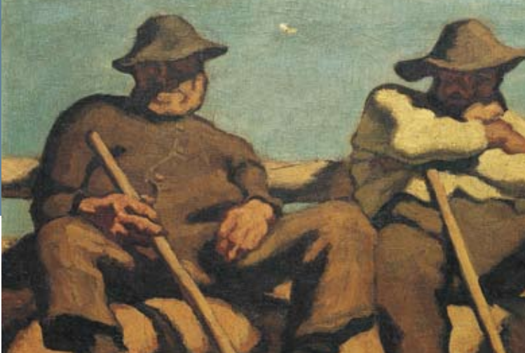
Ruhende Hirten, Öl auf Leinwand, um 1918.

Anti-Kriegsbilder jedoch nie, diese gerieten während der NS-Zeit in Vergessenheit. Der 1926 verstorbene Maler aus Osttirol stand den Nationalsozialisten fern, ihn kann man wohl eher als einen Mahner des Krieges bezeichnen. Seine Bilder – Antikriegsbilder. Doch weder er noch irgend ein anderer Mensch konnte den weiteren Verlauf der Geschichte abwenden. 63 Jahre nach Kriegsende befinden sich noch immer