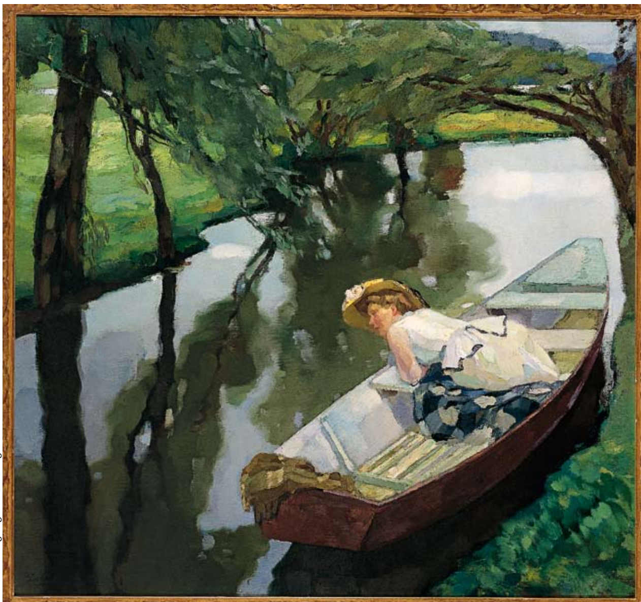
Im Kahn, von Leo Putz, Öl auf Leinwand, um 1911, Sammlung Unterberger.

In der Zeit von 1909 bis 1914 entstanden von Leo Putz eine Reihe von atmosphärischen Kahnbildern.