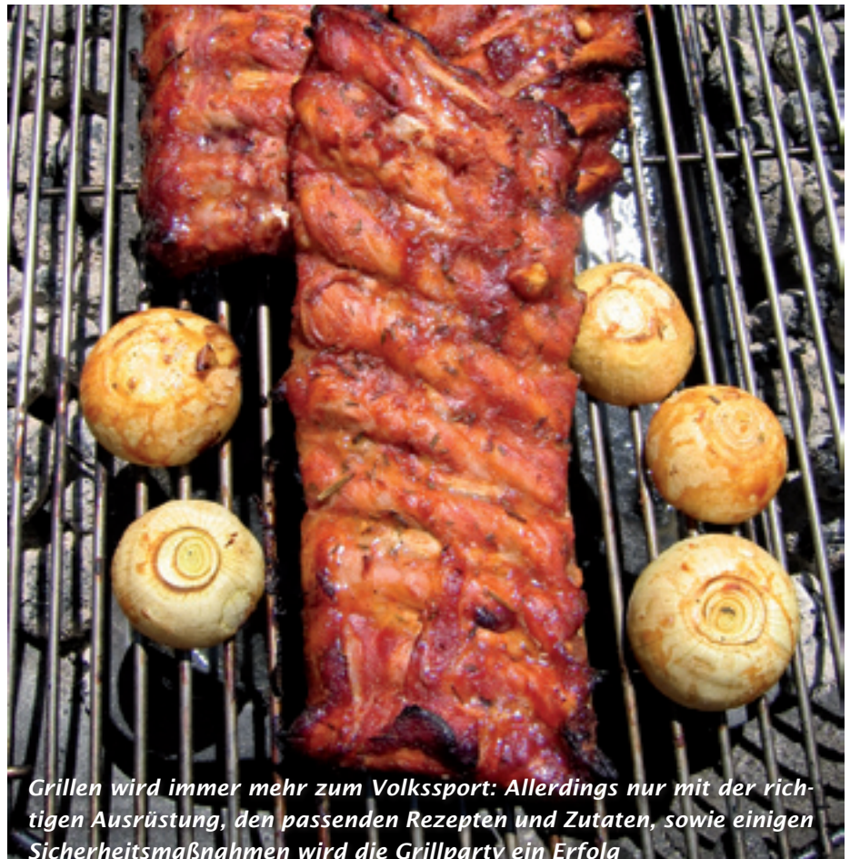
Grillen wird immer mehr zum Volkssport: Allerdings nur mit der richtigen Ausrüstung, den passenden Rezepten und Zutaten, sowie einigen Sicherheitsmaßnahmen wird die Grillparty ein Erfolg