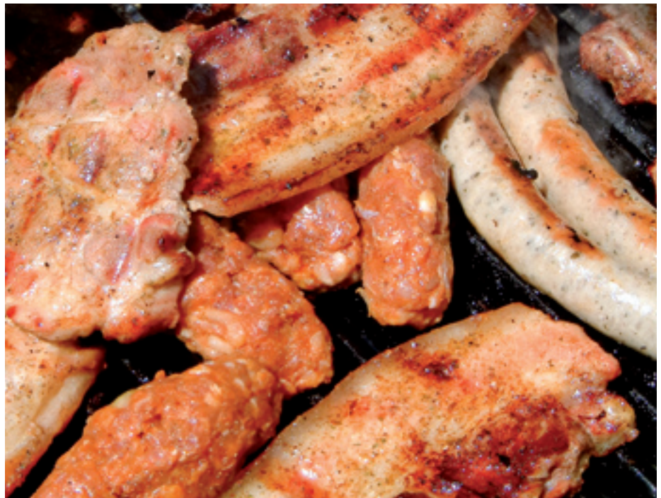
Eine Gartenparty ohne Grillvergnügen ist nur eine halbe Sache: Mageres Fleisch in dünne Scheiben schneiden. Diese werden nicht so schnell schwarz. Falls doch: Dunkle Krusten gnadenlos wegschneiden!

Doch inzwischen ist auch dieses letzte männliche Refugium bedroht. Und die