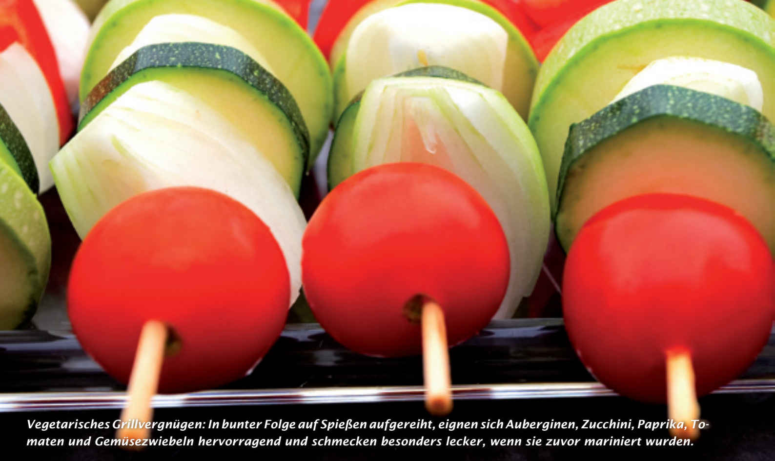
Vegetarisches Grillvergnügen: In bunter Folge auf Spießen aufgereiht, eignen sich Auberginen, Zucchini, Paprika, Tomaten und Gemüsezwiebeln hervorragend und schmecken besonders lecker, wenn sie zuvor mariniert wurden.

vollendete Grillgenuss aber erhalten bleibe. Über was sollen richtige Männer künftig beim Grillen noch diskutieren, wenn nicht über das Feuermachen? Wieviel Watt der Elektrogriller verbraucht? Wie Strom sparend die Glühschlangen sind? Über die Bedienerfreundlichkeit des Gerätes? Wenn sich der Elektrogrill wirklich durchsetzt, ist das „Mannsein“ ein für allemal besiegelt und es wird so weit kommen, dass es nicht mehr „du Warmduscher“ sondern „du Elektrogriller“ heißt.