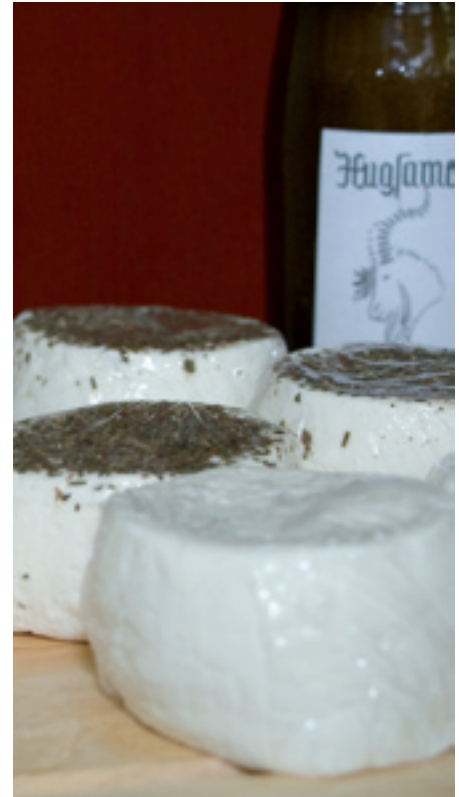
Ziegenfrischkäse wird auch von Allergikern immer mehr gekauft.