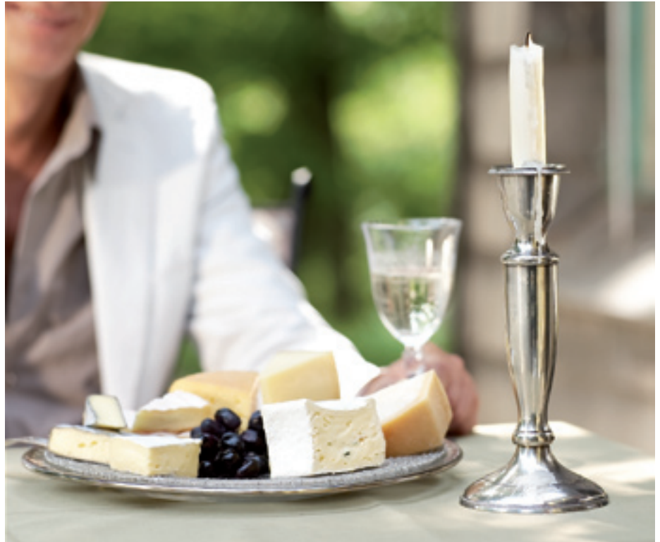
Käse sollte temperiert serviert werden. Die Käsespezialitäten am besten eine halbe Stunde vor dem Essen aus dem Kühlschrank nehmen.

Egal jedoch ob Ziegen-, Schafs- oder Kuhmilchkäse, für einen vollendeten Genuss sollte Käse mindestens eine halbe Stunde vor dem Verzehr bei Zimmertemperatur „aufwärmen“. Nur dann entfaltet er sein volles Aroma. Vorsicht jedoch während der heißen Sommermonate: Wird der Käse zu lange warmen Temperaturen ausgesetzt, zerfließt er schnell und verliert an Geschmack. Also: Käse richtig temperieren – dann schmilzt er auf der Zunge und nicht am Teller.