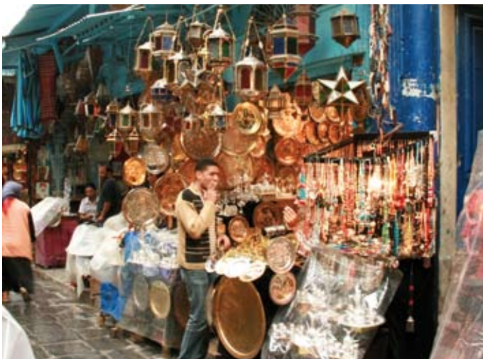
Am traditionellen Souk in Tunis finden Touristen unter anderem die traditionellen künstlerischen Kupfer-Treiarbeiten.

Thalasso wird in insgesamt rund 40 Hotels in Tunesien angeboten. Unser Besuch in zwei Hotels und den angeschlossenen Kurzentren hinterlässt jedenfalls einen guten Eindruck: Die Massagen waren fachlich kompetent, kraftvoll und gut. Die Wannensprudelbäder samt Farblithotherapie entspannend und