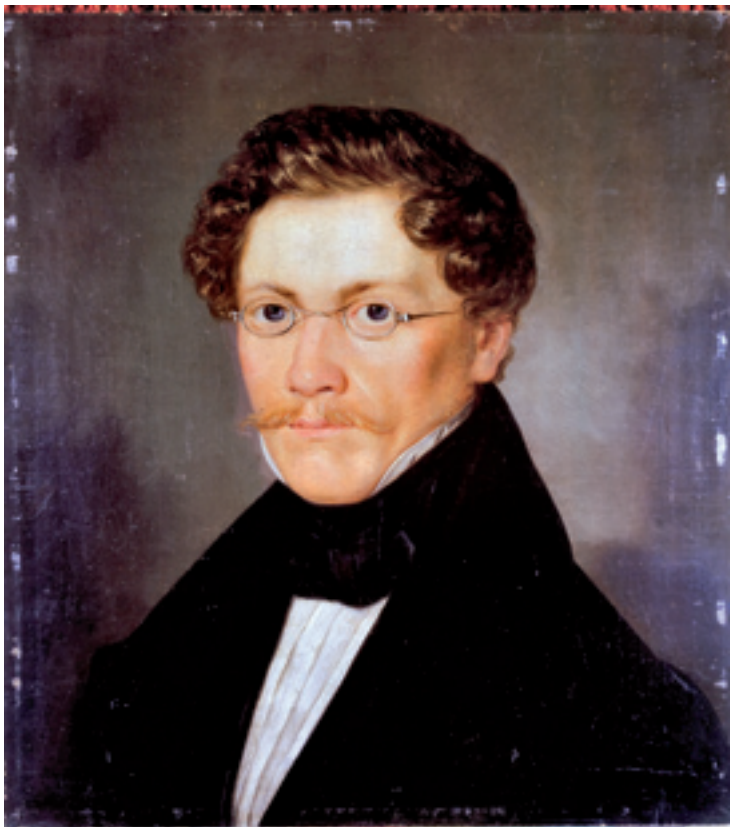
Carl Spitzweg, „Selbstbildnis“, um 1840/42