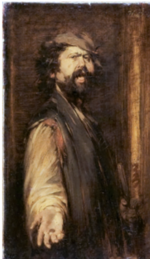
Wilhelm Busch, „Selbstbildnis als Bettler“