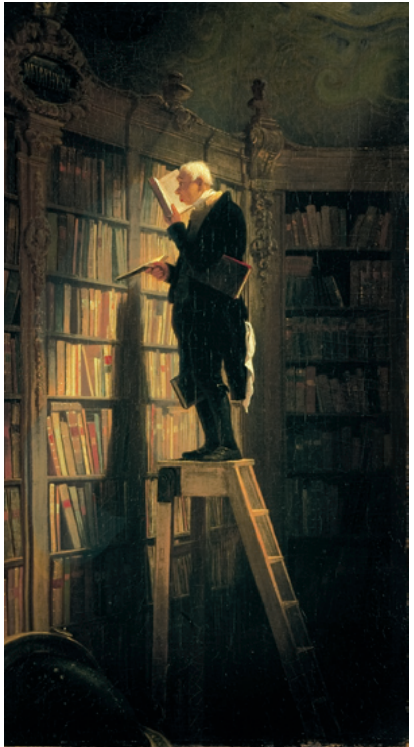
„Der Bücherwurm“ von Carl Spitzweg (oben). Liebevoll, humoristisch, aber ohne Zynismus deckt der Maler menschliche Schwächen auf. Rechts: „Der Kakteenfreund.“