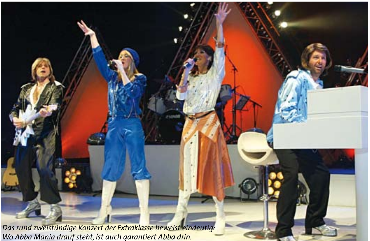
Das rund zweistündige Konzert der Extraklasse beweist eindeutig: Wo Abba Mania drauf steht, ist auch garantiert Abba drin.