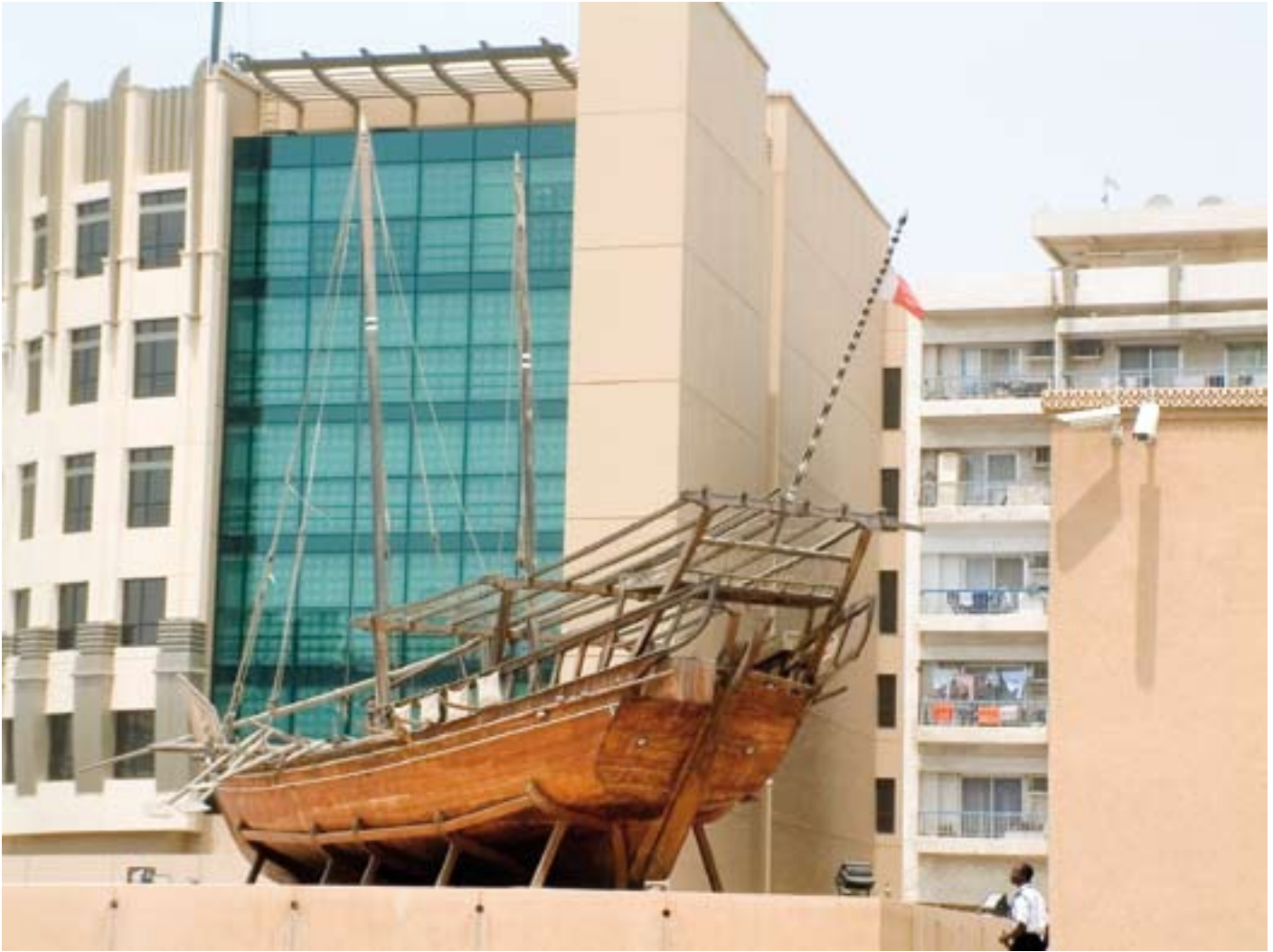
Das Modell eines traditionellen arabischen Schiffs im „Al Faheidi Fort“ in Dubai. Dieses enthält auch das Dubai Museum und stammt aus dem Jahr 1971. Damit zählt das restaurierte Fort immer noch zu den ältesten Gebäuden der Emirates.

Läden des „alten“ Souks, sondern abbruchreife Lagerhallen des Hafens. In diesem Viertel befindet sich auch das Dubai-Museum, das bedeutendste Museum der Vereinigten Arabischen Emirate. Der Besucher erfährt – etwas romantisieret – die Geschichte des heutigen Staates. Dessen Beginn lässt sich bis ins 4. Jahrtausend v. Chr. zurückverfolgen. Wirklich viel passiert ist in den folgenden 6.500 Jahren jedoch nicht. Die wenigen Menschen, die die Unbill der Wüste auf sich nahmen, lebten in kleinen Stadt-