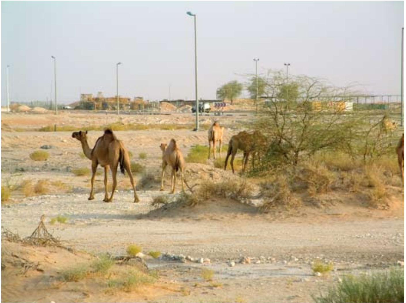
Wilde Kamele auf den Schutthalden der Industriebaustellen. Abseits der Sperrzäune der Autobahnen warnen Hinweisschilder vor den aggressiven Tieren.

S kihallen mitten in der Wüste, Sechs- und Sieben-Sterne-Hotels, Golfplatzoasen mit Flutlichtbeleuchtung, künstliche Inselgruppen in der Form von Palmen oder der Weltkugel, neue Guggenheim-Sammlungen und eine Imitation des Louvres... – ein Projekt übertrifft das nächste. In den Vereinigten Arabischen Emiraten scheint nichts unmöglich zu sein, Naturgesetze werden einfach aufgehoben. Das nötige „Kleingeld“ dazu strömt seit den 60er Jahren nahezu unbegrenzt in Form von