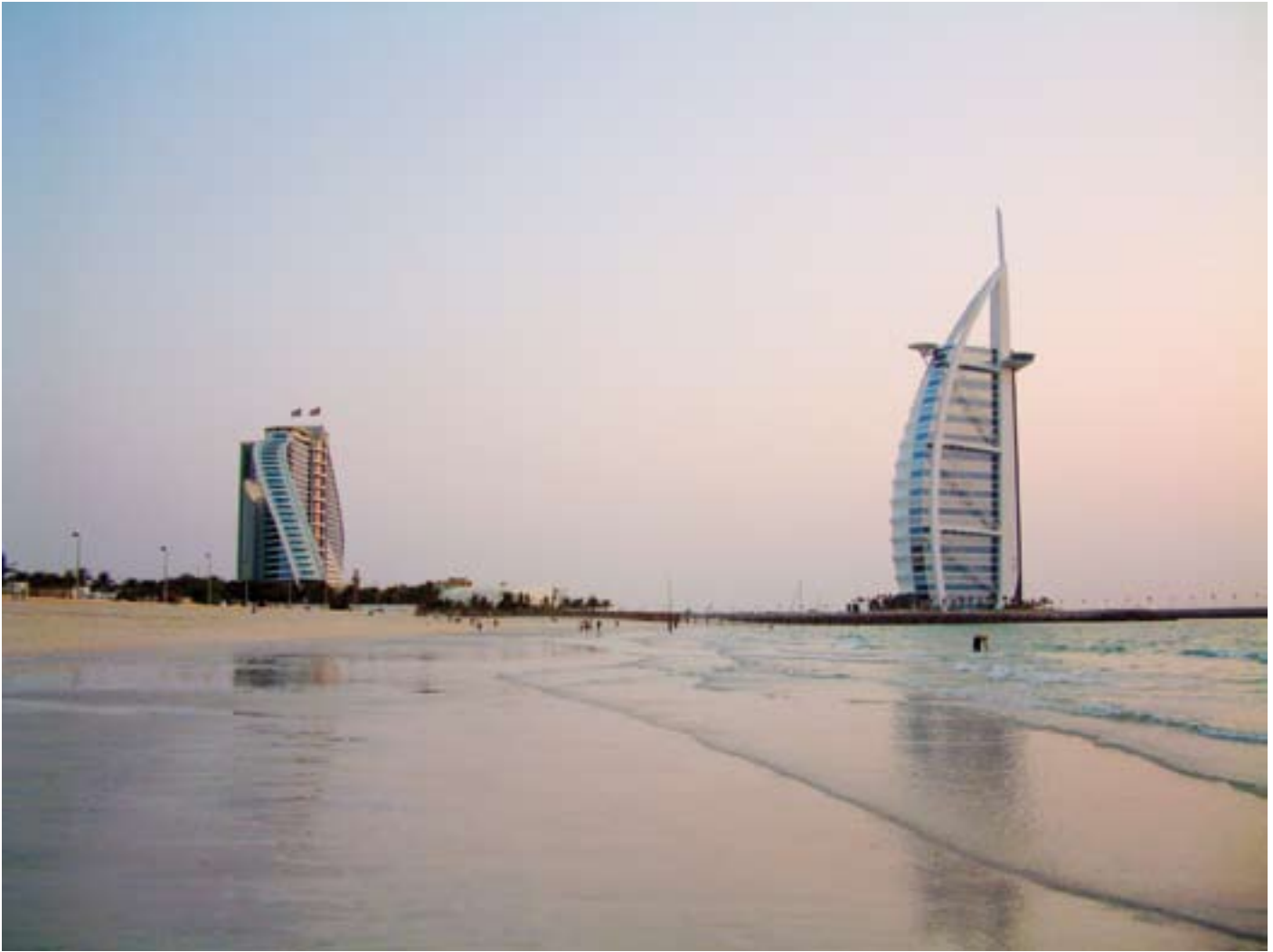
Urlaubsparadies Dubai wie es alle Welt kennt: Links das Jumeirah-Beach-Hotel, rechts das Burj al Arab. Davor der Jumeirah Beach, der weiße Sandstrand von dem viele Karibik Inseln nur träumen können.

den Emiraten doch streng an die Sure 33,59 des Korans: „Sage, o Prophet, deinen Frauen und Töchtern und den Frauen der Gläubigen, dass sie ihr Übergewand (über ihr Antlitz) ziehen sollen, wenn sie ausgehen.“ In der Burka werden so die aktuellen Modetrends begutachtet und ausgewählt. Nicht-islamische Frauen können sich in Abu Dhabi, Dubai, Schardscha und den anderen großen Küstenstädten aber problemlos nach europäischer Etikette bewegen. Erst im Landesinneren, wie in der Wüstenstadt Al Ayn, empfiehlt sich das