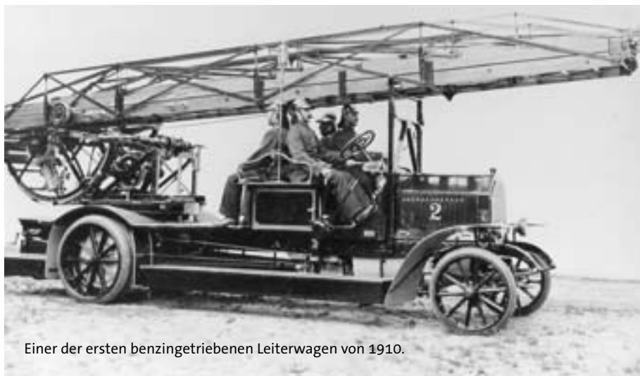
Einer der ersten benzingetriebenen Leiterwagen von 1910.

Feuerwehrfahrzeuge haben sich in ihrer über 100-jährigen Geschichte technisch, entsprechend ihrer neuen Aufgaben, weiterentwickelt. Nicht nur wegen der geänderten Farbe haben sie nichts mehr mit den Klassikern aus den Anfängen des 20. Jahrhunderts gemein. ■