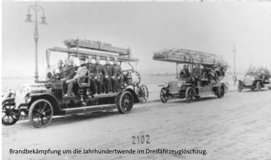
Brandbekämpfung um die Jahrhundertwende im Dreifahrzeuflöschzug.