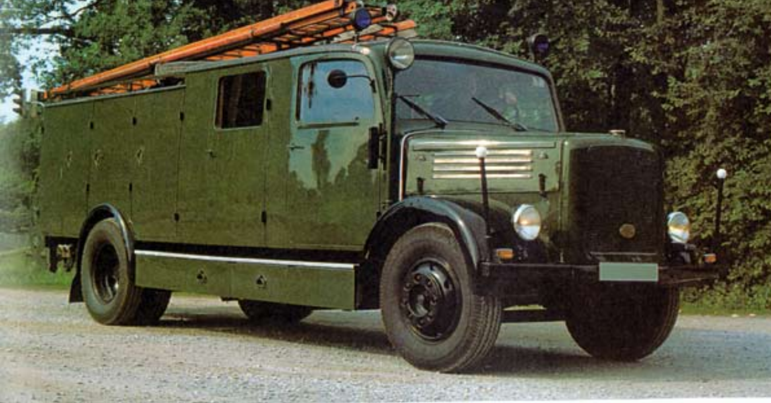
Eines der letzten grünen Feuerwehrfahrzeuge der Tiroler Feuerwehren.