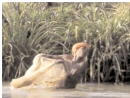
Flusslandschaft in Zentralindien: So schön wie die Wachau

„Expedition light“: So könnten die Menschen auch 2.000 v. Chr. gelebt haben