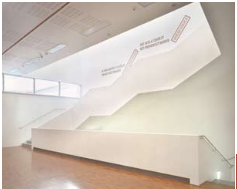
Zukunftsweisend: die Tiroler Landesmuseen Betriebsgesellschaft soll als Marke das Gedächtnis von Tirol bilden.

So möchte der designierte Innsbrucker Museenleiter die Menschen für den Museumsbesuch gewinnen: Sie sollen einen Bezug zum eigenen Leben herstellen. Als Beispiel führt er das Bild einer Familiendarstellung des Malers Pflug im Zeppelinmuseum an. „Die Szene an sich ist fürchterlich, keiner möchte in so einer Familie leben. Doch wenn der Besucher beginnt, die einzelnen Personen mit seinen Verwandten zu vergleichen und somit einen Bezug zum eigenen Leben herzustellen, dann wird das Bild spannend für den Betrachter.“ Um dieses „Einlassen“ auf die Kunst zu erwirken, muss sich das Museum nach Ansicht von Wolfgang Meighörner immer am Publikum orientieren. Das bedeutet, dass es nicht nur um den fachwissenschaftlichen Auftrag geht, sondern die Interessen der Besucher im Vordergrund stehen. Damit die Mitarbeiter das Bewusstsein dafür nicht verlieren, lässt der noch amtierende Direktor im deutschen Zeppelinmuseum alle Mitarbeiter regelmäßig Führungen durch die Ausstellung machen. Auch er selbst erklärt mit Freude und Begeisterung die Exponate und deren Geschichte. Geht es nach Wolfgang Meighörner, so identifizieren sich alle Angestellten vollkommen mit dem Museum: „Jeder Einzelne sollte fest davon überzeugt sein, dass das eigene Museum das tollste unter der Sonne ist.“ Diese Motivation möchte der Deutsche auch den Leuten in Innsbruck mit in die Arbeit geben. Mit dieser Einstellung will er auch mögliche Vorbehalte bei