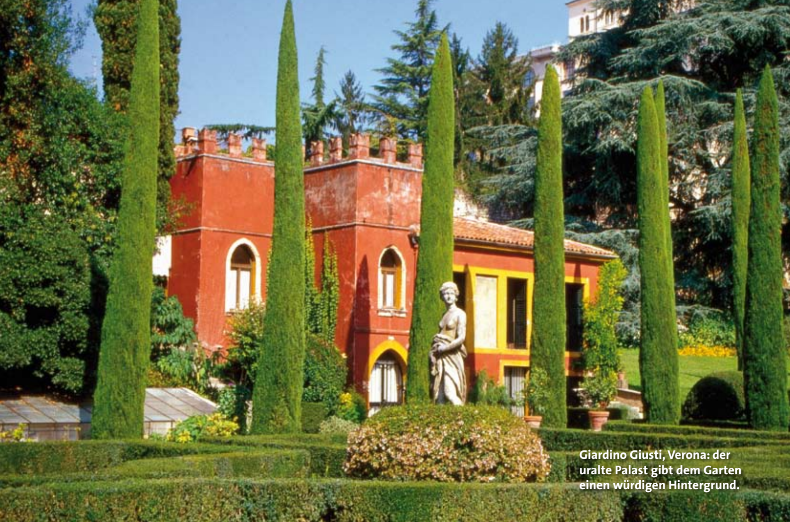
Giardino Giusti, Verona: der uralte Palast gibt dem Garten einen würdigen Hintergrund.