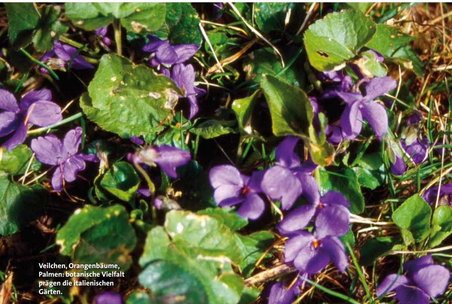
Veilchen, Orangenbäume, Palmen: botanische Vielfalt prägen die italienischen Gärten.

Auf dem langen Weg von Italiens Gärten bis hinauf in den Norden Deutschlands zum schlichten, aber weltberühmten Goethe'schen Gartenhaus in Weimar dürften noch viele grüne Refugien mit Erinnerungstafeln auf ambitionierte Entdecker warten. Auch wenn dieser Ausspruch nicht aus Goethe's angebotener Feder stammt, die philosophische Weisheit, dass der Weg das Ziel sei, erscheint für diese dichterische Spurensuche wunderbar passend. ■