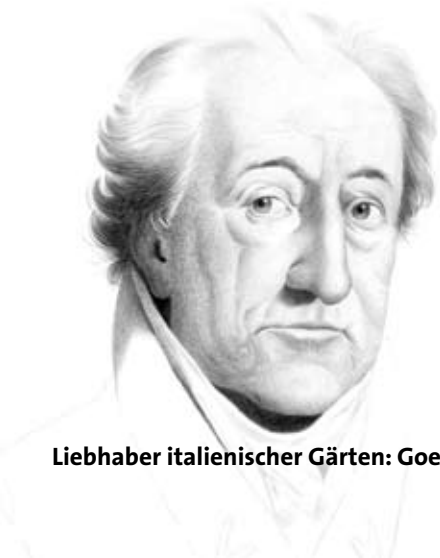
Liebhaber italienischer Gärten: Goethe

W er sich jedoch intensiver mit den poetischen Schilderungen des reise- und schreibfreudigen Geheimrates beschäftigt, kann viele Details dieser im Übrigen zwei volle Jahre, von 1786 bis 1788, andauernden „Italienischen Reise“ in Erfahrung bringen. So erlebt man, sozusagen hautnah, die Dramatik seiner rasanten Fahrt hinunter vom Brenner gen Süden, auf der seinem Kutscher die Pferde durchgingen. Ebenso eindrucksvoll ist die Schilderung der in krassem Gegensatz dazu stehenden fatalen Flaute, die sein