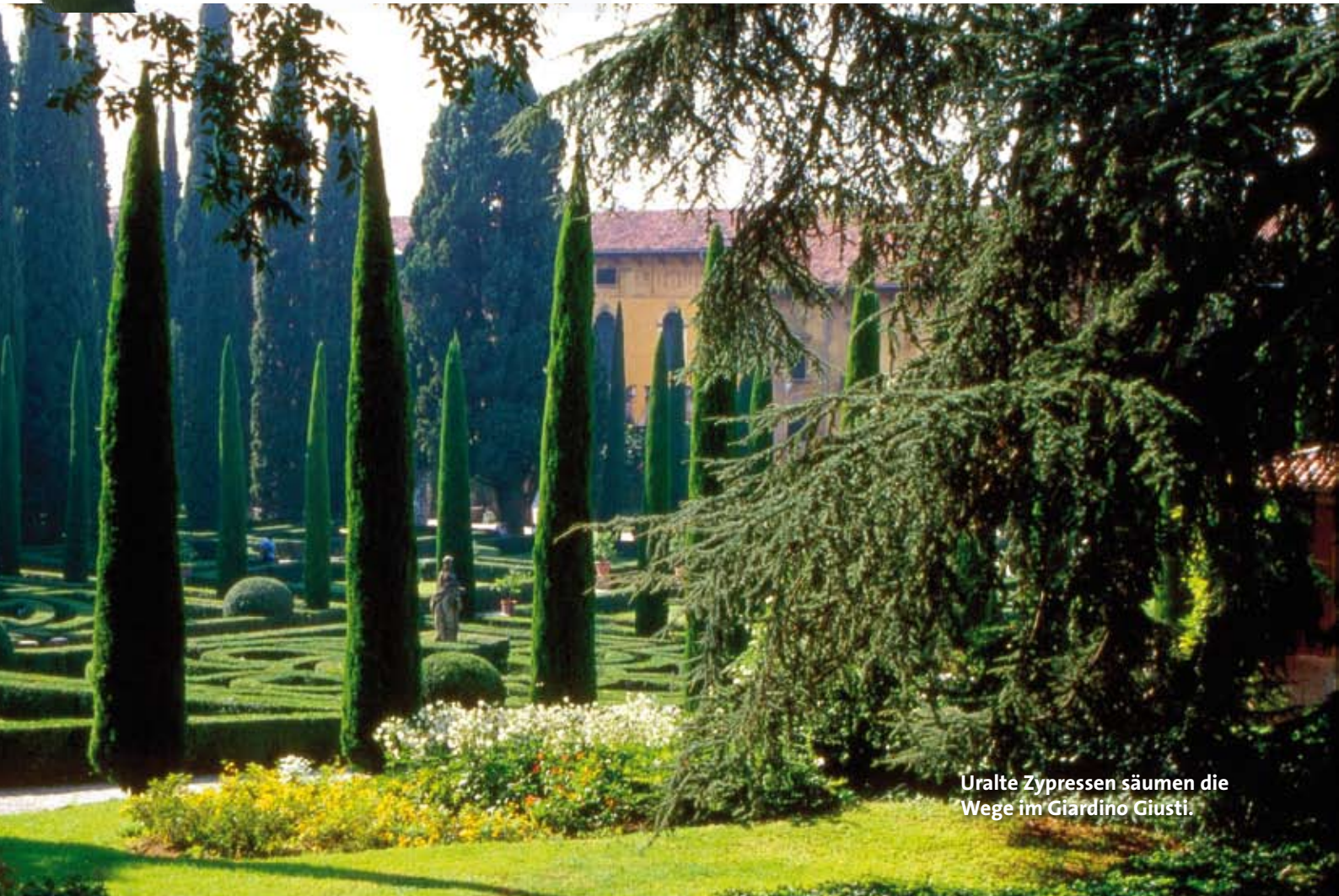
Uralte Zypressen säumen die Wege im Giardino Giusti.

Ein Teil der einfach zu groß gewordenen und das geometrische Gartendesign erdrückenden Zypressen wurde vor eini-