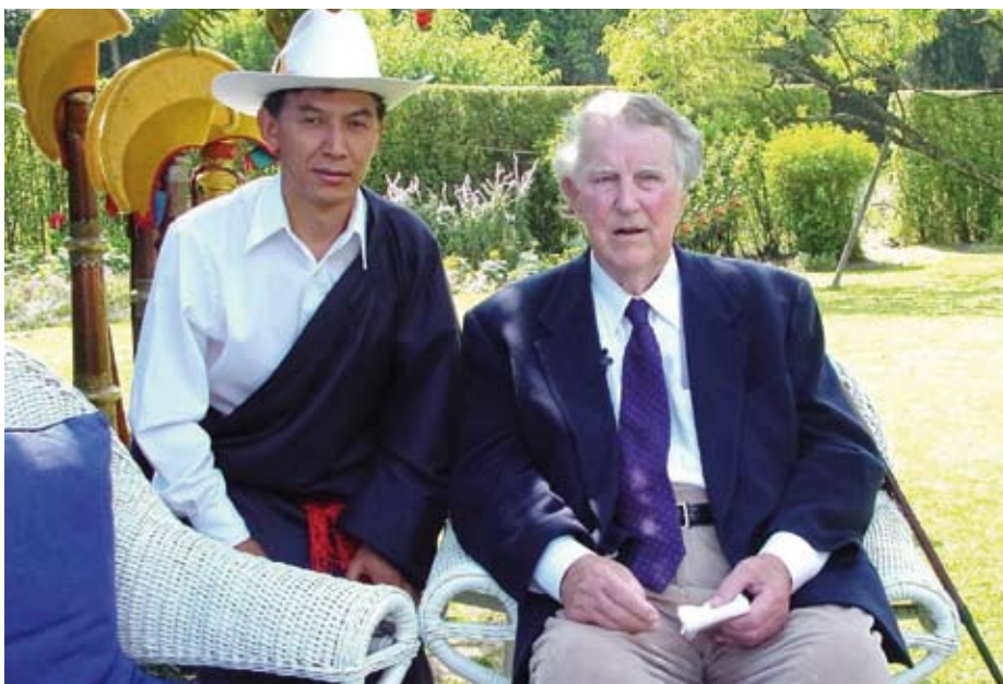
Das „zweite Leben“: Nachdem er bei seinen Expeditionen die Lebensumstände der Sherpas näher kennen gelernt hatte, setzte sich Hillary für Verbesserungen ein.

die Schweiz. Erstes Ziel: Innsbruck, wo die drei Männer nach einer Marathon-Zugfahrt von London über Paris so übernünftig und unrasiert ankamen, dass sie in den besseren Hotels abgewiesen wurden und in einer einfachen Pension nächtigten – was auch dem Budget der drei Freunde weitaus besser entsprach, wie Hillary selbst zugab. Einen detaillierten Plan für die Tage in den Alpen hatten sich die drei allerdings noch nicht zurechtgelegt: „Wir wussten nur wenig über die österreichischen Berge, und als wir einen kleinen Prospekt über die Stubai Alpen