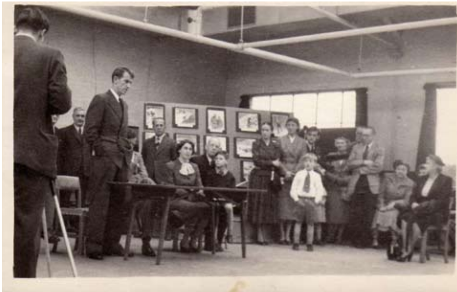
Nach der Erstbesteigung des Mount Everest stand Edmund Hillary im Zentrum des öffentlichen Interesses. Seine Vortragsreisen führten ihn sogar bis nach Südafrika.