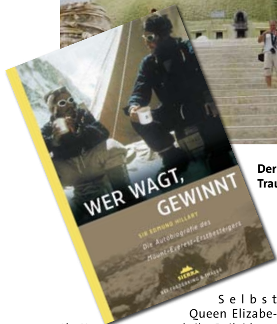
Der Mount Everest im nepalesischen Himalaya: Das Team Hillary-Norgay erfüllte den Traum von der Erstbesteigung. In seiner Autobiographie schildert Hillary den Gipfelsieg.

Selbst Queen Elizabeth II sprach ihr Beileid aus – hatte doch die Seilschaft Hillary-Norgay die Erstbesteigung genau zu ihrem Krönungstag geschafft und quasi einen britischen Gipfelsieg errungen. Premierministerin Clark fasste Hillarys Bedeutung und seinen Charakter sehr treffend zusammen: „Er war Kiwi durch und durch. Er gehörte zu uns – mit seiner schroffen Erscheinung, seiner lakonischen Art, seiner Direktheit und Ehrlichkeit.“ Er sei eine „heldenhafte Figur“, die nicht nur den Mount Everest bezwungen habe, sondern ein „Leben der Entschlossenheit, der Bescheidenheit und Großzügigkeit“ geführt habe. Sir Edmund Hillary selbst sah sich nie als besonderer Held. Selbst die Besteigung des höchsten Gipfels der Welt erschien in seinen Augen als kein besonderer Akt. In seiner Autobiografie schreibt er, ihm fehle der Mut und die Ruhe für heldenhafte Haltung: „Wohl war ich körperlich kräftig, doch es fehlten mir die Gewandtheit und der scharfe Blick der