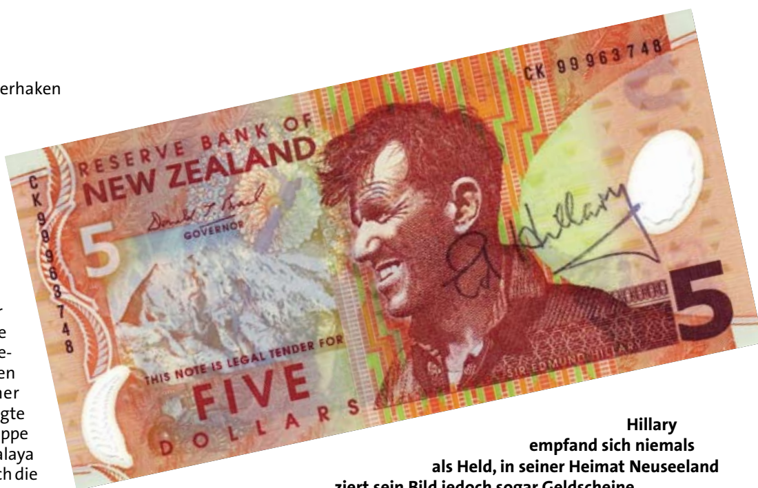
Hillary empfand sich niemals als Held, in seiner Heimat Neuseeland ziert sein Bild jedoch sogar Geldscheine.