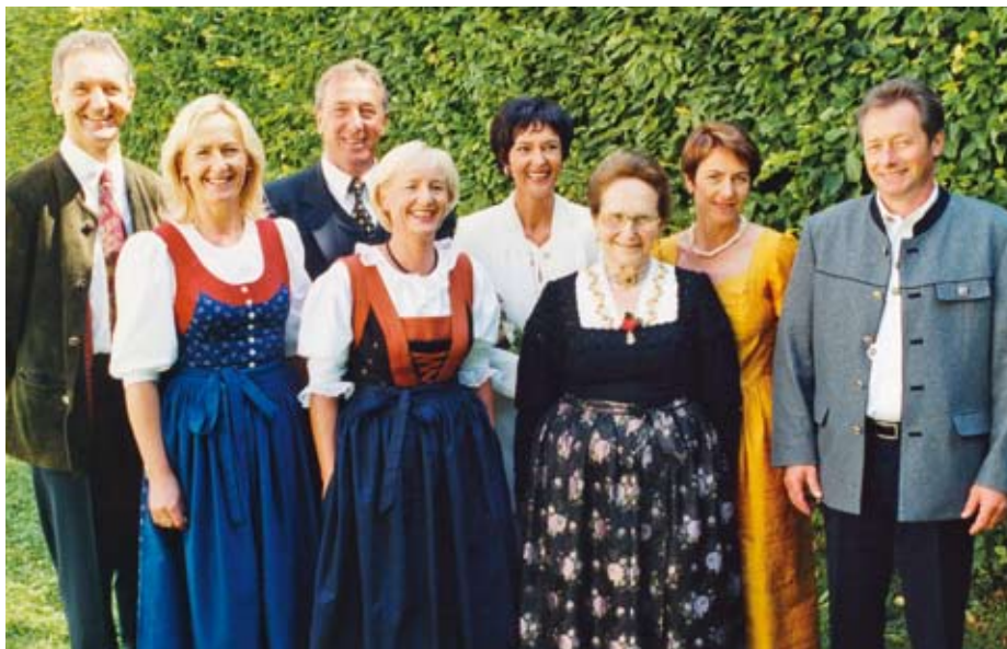
Die Jubilarin im Kreis ihrer erwachsenen Kinder: Es gibt drei Dinge, die man sich merken sollte: Die zehn Gebote Gottes halten, das Einmaleins können und Mozart lieben.

Mittags gab es immer Suppe und Hauptspeisen, die den Jahreszeiten an-