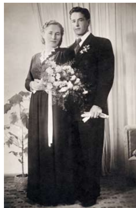
Hochzeitsbild: „Ich hatte nie das Gefühl, weniger Wert zu sein als mein Mann.“

so weiter. Das Einmaleins bedeutet, dass dort, wo man hingestellt ist, man seine Pflicht erfüllen muss, egal in welchem Beruf und egal ob Mann oder Frau. Mozart lieben heisst, man soll die Freizeit sinnvoll gestalten. Der Mensch braucht Freude, Musik, Tanz, Sport und so weiter. Wenn man sich bemüht nach diesen einfachen Regeln zu leben, ist man auf dem rechten Weg und kommt auch einmal ans rechte Ziel. Es gibt überall Vor- und Nachteile. Wenn man das als Bäuerin abwägt, sieht man, dass man stolz sagen kann: „Ich bin eine Bäuerin.“