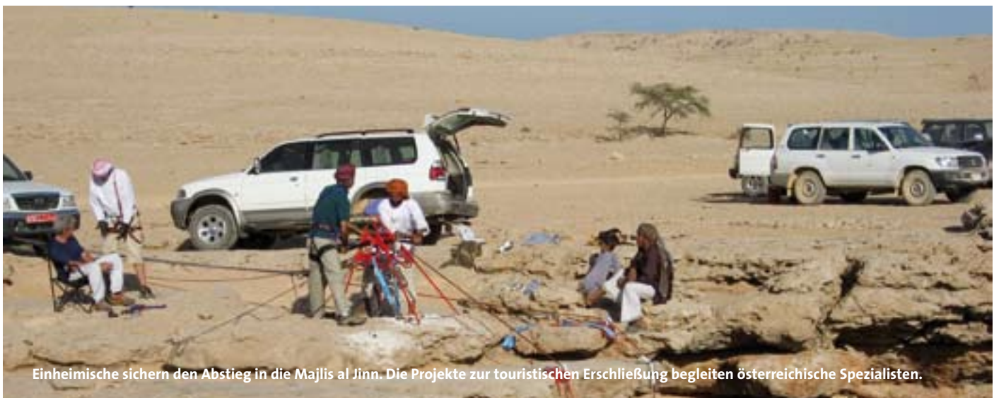
Einheimische sichern den Abstieg in die Majlis al Jinn. Die Projekte zur touristischen Erschließung begleiten österreichische Spezialisten.

herrschen im windigen Küstenbereich Temperaturen um 25 Grad, in den Bergen können auch Schnee und Minustemperaturen vorkommen. Im Sommer erwarten den Gast Hitzewellen mit durchschnittlich 50 bis 55 Grad, die Hauptstadt Muscat gehört zu den heißesten Städten der Welt, hier zeigt das Thermometer im Sommer oft nachts noch 45 Grad. Klimatisch teilt sich der Oman in zwei Teile: Über die südliche Gegend um die Weihrauchstadt Salalah gehen zwischen Juli und September die Ausläufer des Monsun nieder. Um diese Zeit suchen die Bewohner der nördlicheren arabischen Halbinsel, die gerade in Gluthitze versinkt, Abkühlung im südlichen Oman. Den Europäern empfiehlt Helmut Ohnmacht jedoch, etwas später anzureisen, wenn sich die Vegetation nach den starken Regenfällen wieder voll entfaltet. Im Norden hingegen können das ganze Jahr über starke Niederschläge auftreten. Auch in 2.000 Meter Höhe steigen die Temperaturen noch auf 35 Grad am Tag, nachts kann es allerdings empfindlich