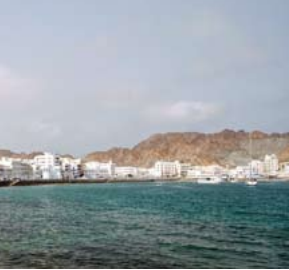
Grad. Im Süden des Landes gehen von Juni bis September Ausläufer der Monsunregen nieder.