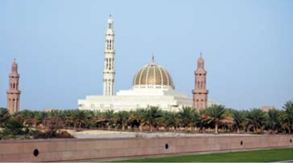
Die Moschee in Muscat: Die Omani vertreten einen gemäßigten Islamismus. Das Sultanat schlägt die Brücke zwischen Tradition und Moderne, zwischen Märchen und Realität.