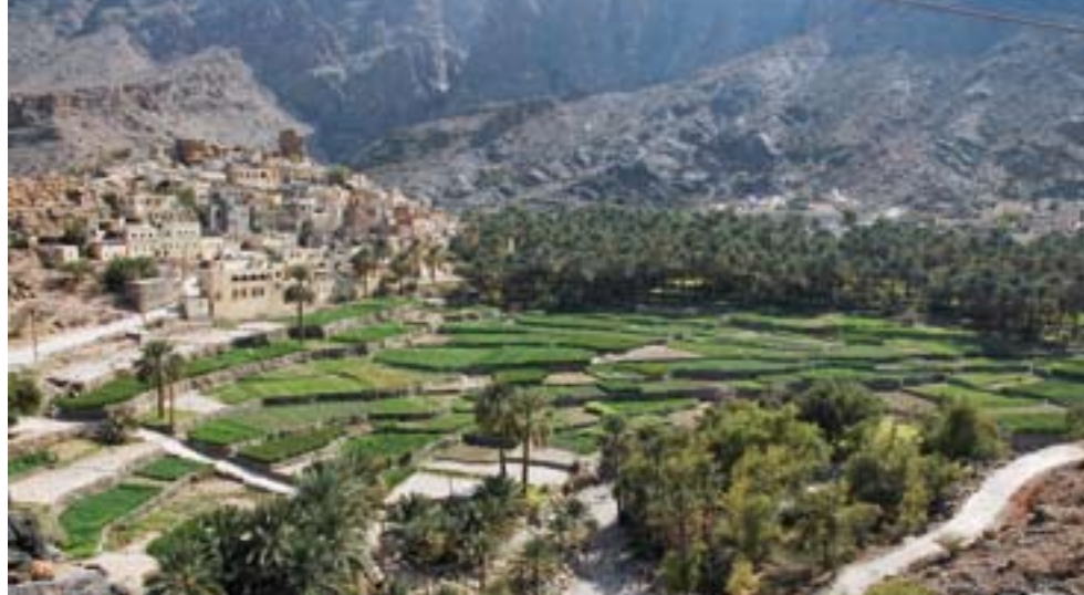
Neue Infrastrukturen machen den Oman zu einem Land nach europäischen Maßstäben. Im Sommer ziehen sich die Omani wieder gerne in ihre alten, kühlen Lehmhütten zurück.

kühl werden. Die Bewohner der Dörfer in diesen Gegenden siedeln bei heißen Temperaturen inzwischen teilweise wieder gerne in ihre alten Lehmhütten zurück, die sie für moderne Bauten verlassen haben. Die Regierung bemüht sich zudem um die Revitalisierung der alten Gemäuer, die das Landschaftsbild mitprägen. Verlassene Dörfer machen sich eben nicht gut in einem Land, das sich dem Tourismus, wenn auch auf sanfte Weise, öffnet. Den Reisenden empfiehlt Helmut Ohnmacht,