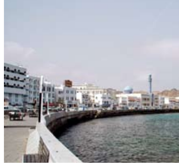
Promenade in der Hauptstadt Muscat: Im Sommer herrschen hier Temperaturen um 50