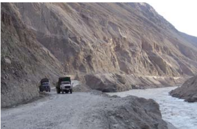
Pakistanisches „Verkehrsabenteuer“ Karakorum-Highway

In den Akklimatisierungstagen traf die Gruppe dann ein schwerer Schock: Ein 52-jähriger Schweizer Gendarm starb