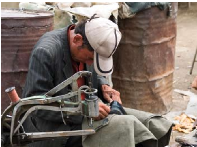
Handwerk: Schusterarbeiten unter primitivsten Bedingungen.