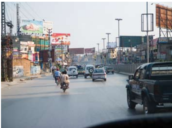
Hauptstraße von Islamabad: Werbung wie in den USA

Auf die Frage, wie schwer er die Tour empfunden hat, erklärt der frühere Lehrer: „Technisch leicht, auch skitechnisch nicht kritisch, wenn man in der Lage ist, auch in extrem dünner Luft mit einem schweren Rucksack, bei Firn und teilweise knietiefem Pulverschnee sicher zu fahren. Konditionell natürlich extrem fordernd aber wichtiger als absolute Top-Kondition ist die Höhenverträglichkeit und physische Toleranz gegenüber fremder Ernährung und mangelnder Hygiene. Auch eine gewisse körperliche Leidenschaft muss vorhanden sein. Erfahrung in großer Höhe, Kälte und biwakieren auf Eis sind von großem Vorteil. Gelohnt hat es sich auf alle Fälle. Es war das größte Bergerlebnis bisher und die Eindrücke werden sicher noch eine Weile anhalten.“