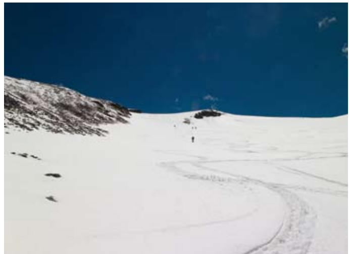
Belohnung für kräftezehrende Aufstiege: die Abfahrten.