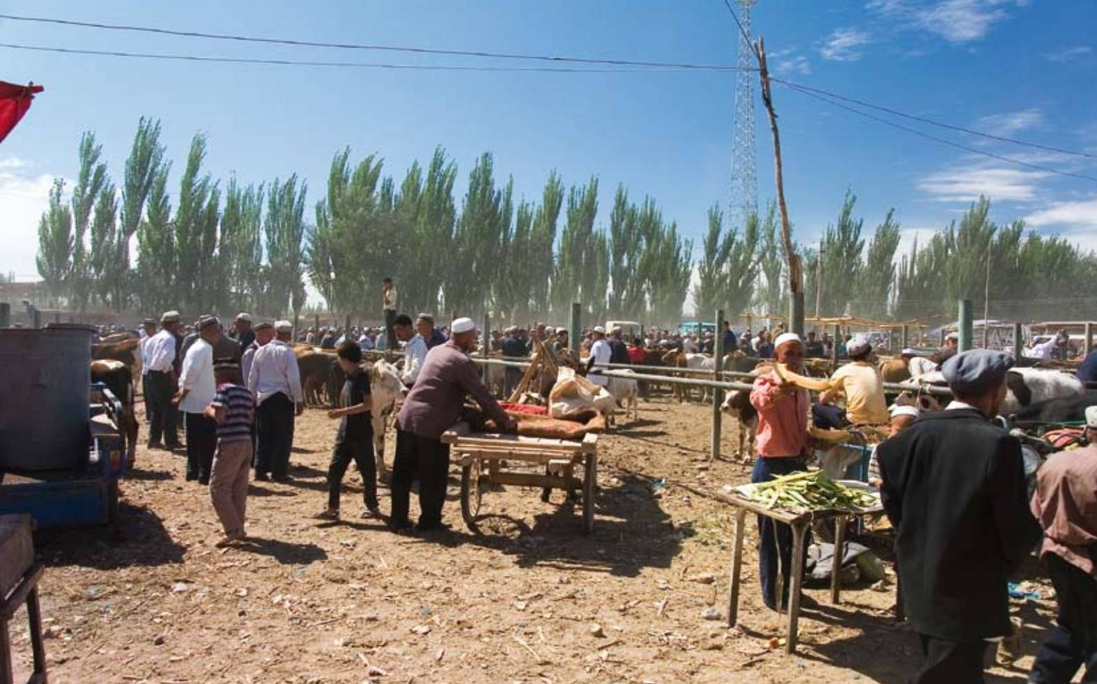
Kontrastprogramm zur Bergexpedition: Die vier Tiroler Bergsteiger lernten auch das Leben in China und Pakistan kennen.