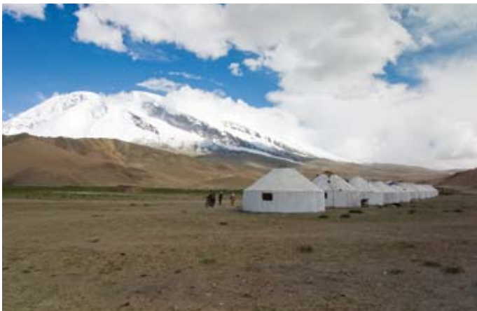
Erster Blick zum Muztagh Ata, davor das Kirgisendorf Shubash.