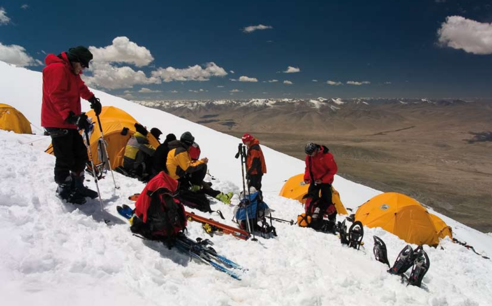
Lager Eins: Ende des Luxus. Den Reisenden machten jedoch mehr die Höhenmeter und die dünne Luft zu schaffen.