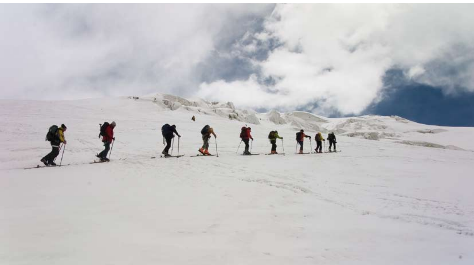
Mit Fellen und Harscheisen auf dem Weg zum Gipfel. Den Tirolern blieb der Gifelsieg jedoch wegen Schlechtwetter versagt.