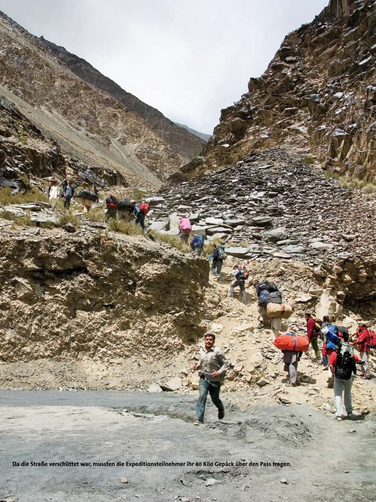
Da die Straße verschüttet war, mussten die Expeditionsteilnehmer ihr 40 Kilo Gepäck über den Pass tragen.