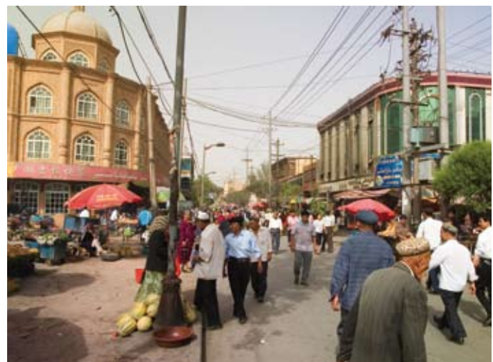
Markt (links) und Innenstadt im chinesischen Kaschka: andere Kultur, andere Lebensweise und viel einfacher als bei uns.