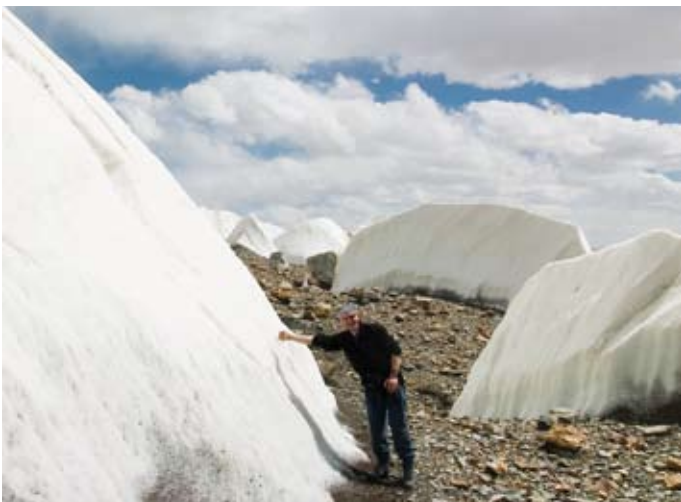
Gigantische Eismengen faszinieren die Männer.