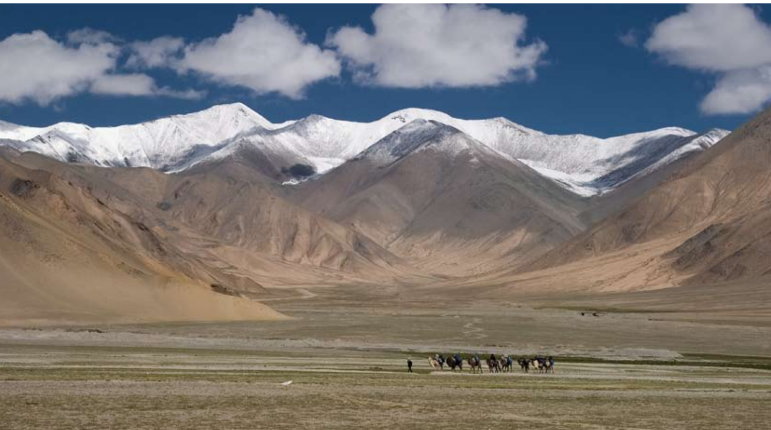
Eine eindrucksvolle Berglandschaft: Die Expeditionsteilnehmer zwischen den chinesischen „Eisriesen“ auf dem Weg zum Lager.