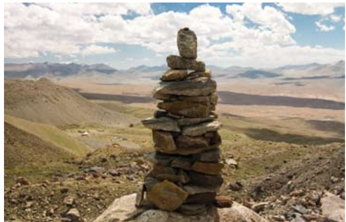
„Steinmandl“ für den am Berg verstorbenen Schweizer.