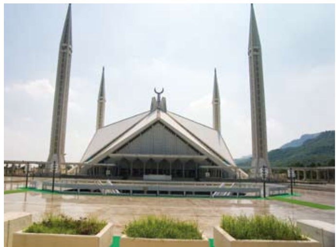
Die Faisal Moschee bietet Platz für 30.000 Gläubige.