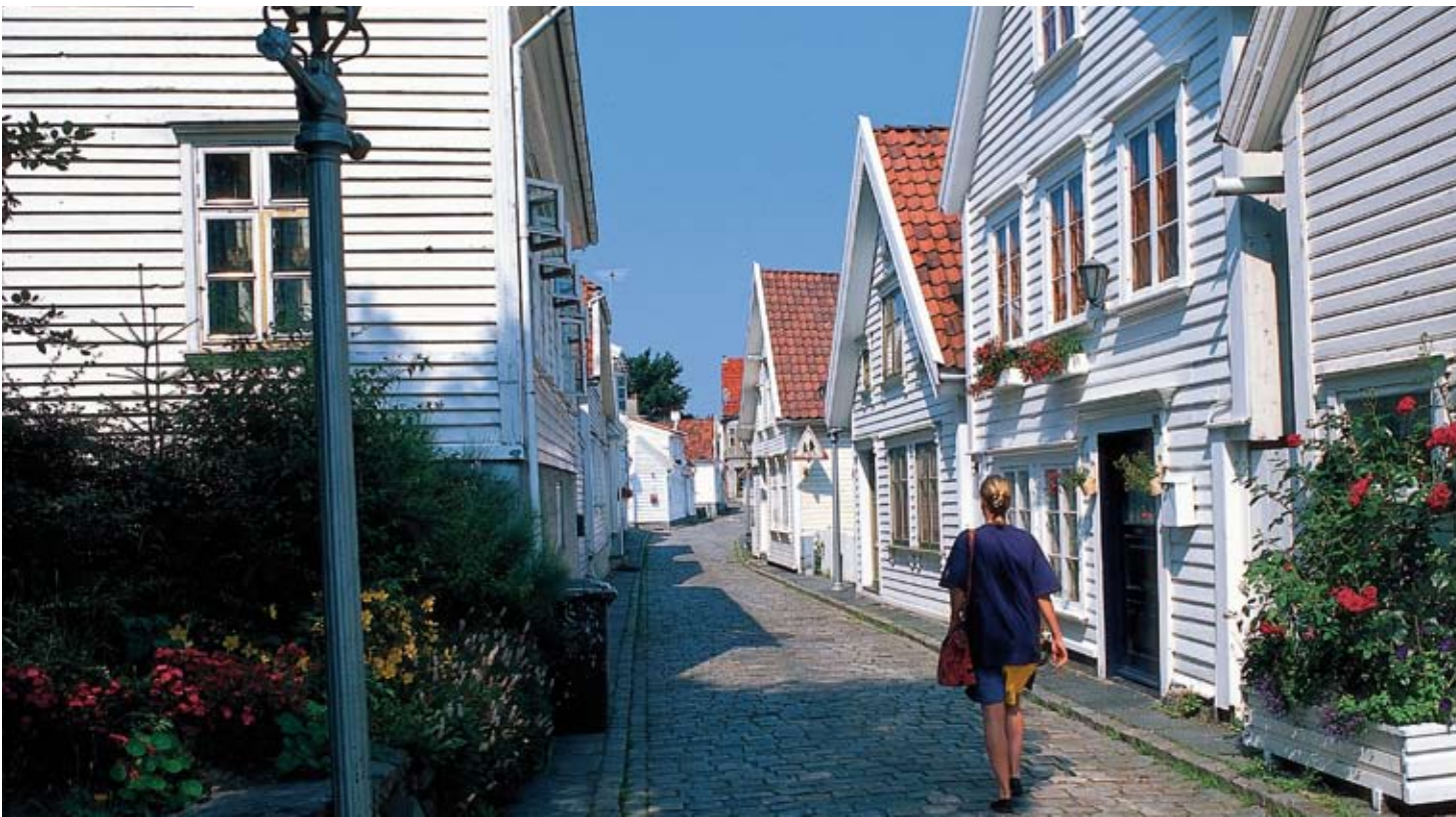
Die Altstadt Stavangers: die Holzhäuser stammen alle erst aus dem 18. Jahrhundert. Frühere Bauten wurden durch Brände zerstört.

der Erschließung neuer Bohrfelder im hohen Norden, etwa beim Barentssee, absehbar. So setzt die Stadt an der Westküste bereits seit längerem auch auf den Tourismus – in der Stadt und in der Region. Nicht nur die Altstadt Gamle Stavanger und der Hafen laden zum Entdecken ein: Der Dom von Stavanger, in dem der Arm des Schutzheiligen St. Svithun als Reliquie aufbewahrt sein soll und der als einzige Kathedrale Norwegens aus dem Mittelalter sein ursprüngliches Aussehen bewahrt hat und kontinuierlich genutzt wurde, steht ebenso auf der Liste der „Sight-Seeing-Musts“ wie die Speicherhäuser und der Fischmarkt. Auch ein Besuch der zahlreichen Museen, etwa des Archäologischen Museums, das 15.000 Jahre Kultur- und Naturgeschichte zeigt, des Flugzeugmuseums, der königliche Residenz Ledaal oder des Norske Barne-museums (Kindermuseum) lohnen. In der näheren Umgebung empfehlen Reiseführer zum Beispiel das Reichsdenkmal „Sverd i Fjell“ (Schwerter im Berg) im Hafersfjord, das auf die Einigung des Reiches durch König Harald Harfagre 872 referiert und für Frieden, Einheit und Freiheit steht. Naturliebhaber werden die Leuchttürme rings um Stavanger abklappern und dann zum Preikestolen fahren, der meistbe-