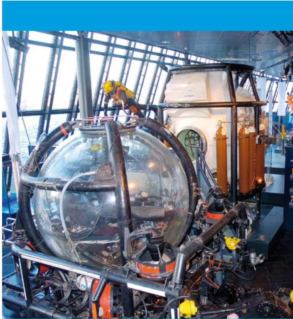
Ölmuseum Stavanger: die Stadt verdankt ihren Reichtum den Ölfunden in der Nordsee.