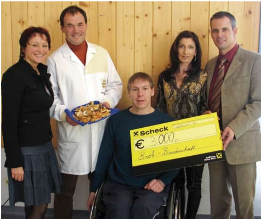
Eine Spendensumme von 3.000 Euro übergab die Brotbruderschaft 2006 einem querschnittgelähmten Tiroler für den behindertengerechten Umbau seines Autos.